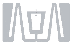
产品设计图 Product design