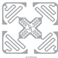
产品设计图 Product design